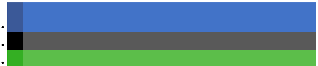
Screenshot, Bundesregierung, 06. Juli 2021