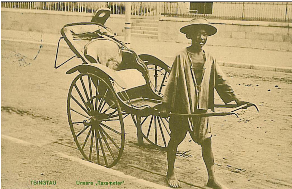
Bild 2. Unser Blick auf China ist auch heute noch von Vorurteilen aus der Kolonialzeit geprägt. Historische Aufnahme aus dem deutschen „Schutzgebiet“ Tsingtau (heute Kiautschou)

In einem weiteren Artikel der gleichen Online-Ausgabe finden sich interessante Zusatzinformationen, aus denen sich einiges über die Hintergründe und Stoßrichtung der neuen KKW-Strategie herauslesen lässt. Es wird darauf hingewiesen, dass China Solar- und Windenergie als zu unzuverlässig für eine stabile Energieversorgung des Landes einstuft. Andererseits scheint das Land aber auch nicht vollständig oder zumindest überwiegend auf Kernkraft setzen zu wollen. Für diese Änderung der früheren Zielsetzung eines massiven KKW-Zubaus werden drei wesentliche Gründe angeführt: Die Fukushima-Ereignisse, die zunehmende Feindseligkeit des Westens und die geringen Uranreserven des Landes. Darüber hinaus lassen sich nicht nur aus den vorhandenen, sondern auch aus manchen nicht vorhandenen Angaben zusätzliche interessante Schlussfolgerungen ziehen.