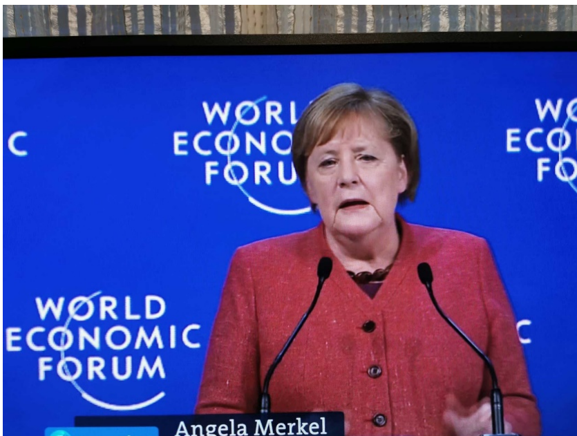
Bild 1. Auf dem World Economic Forum in Davos verunglimpfte Merkel Skeptiker der Hypothese vom „menschengemachten Klimawandel“ als „Leugner“

Einer der gängigsten Vorwürfe der Klimahysteriker gegenüber den Skeptikern, die häufig als „Leugner“ diffamiert werden, läuft darauf hinaus, diese würden „von der Lobby der Industrie der fossilen Brennstoffe mit Milliarden finanziert“. Allein schon der Begriff „Leugner“ ist eine perfide Diffamierung. Erstens wird dadurch unterstellt, dass der Betreffende nicht ernst zu nehmen sei, denn mit dem Begriff „Leugnen“ ist die Vorstellung von „etwas Offenkundiges wider besseres Wissen abstreiten“ verknüpft. Zweitens wird damit ein Sinnzusammenhang zum Begriff „Holocaustleugner“, d.h. zu einem Straftatbestand hergestellt.