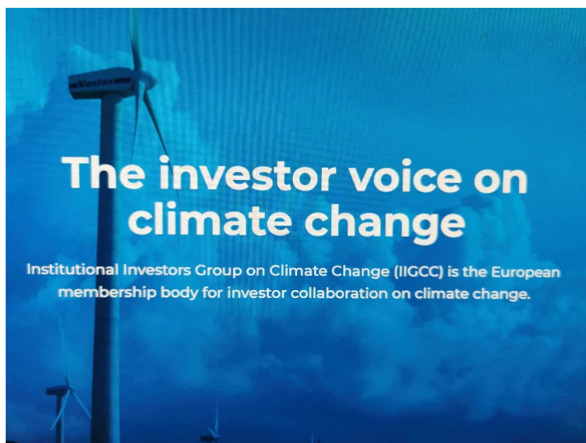
Bild 5. Die IIGCC ist ein Zusammenschluss von europäischen Großanlegern, der Firmen auf Kurs bringt, die sich nicht ausreichend für „Klimaschutz“ engagieren. Freie Marktwirtschaft war gestern

Von deutlich größerem Kaliber ist dagegen die Institutional Investors Group on Climate Change (IIGCC) unter Führung der Deutschen Stephanie Pfeifer. Auch dieser Zusammenschluss aus fast 200 europäischen Großanlegern will in seinem Umfeld mehr Druck für einen strengeren Klimaschutz ausüben.